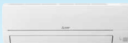
notranja enota MSZ-HR

(**) Poraba električne energije na podlagi standardnih rezultatov testiranja. Dejanska poraba električne energije je odvisna od načina uporabe naprave in kraja montaže.