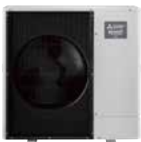
PUZ-SHWM/SWM ali PUD-SHWM