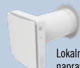
Lokalna prezračevalna naprava AIRA ECO PLUS