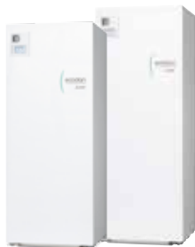
Cylinder 170 L ali 200 L