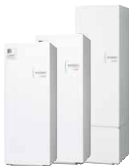
Cylinder 170 L, 200 L ali 300 L